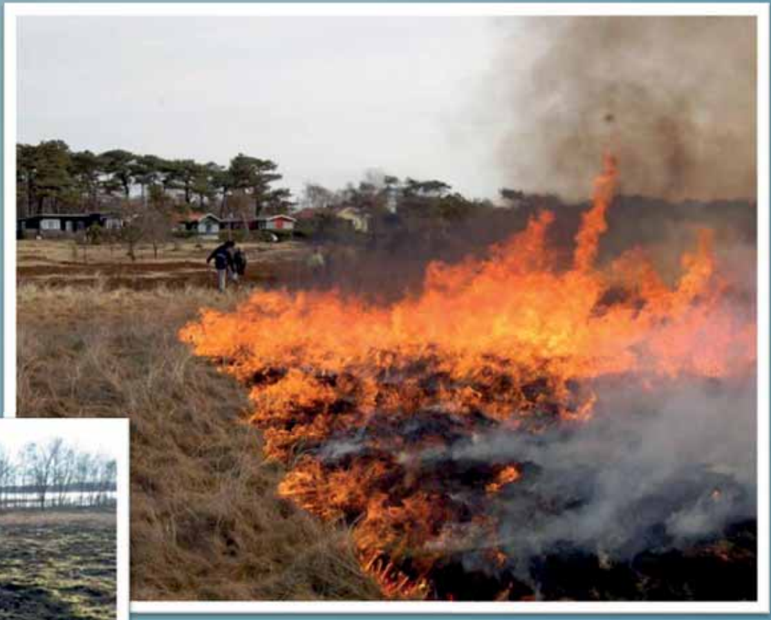
Bränning vid Kullens havsbad 2012