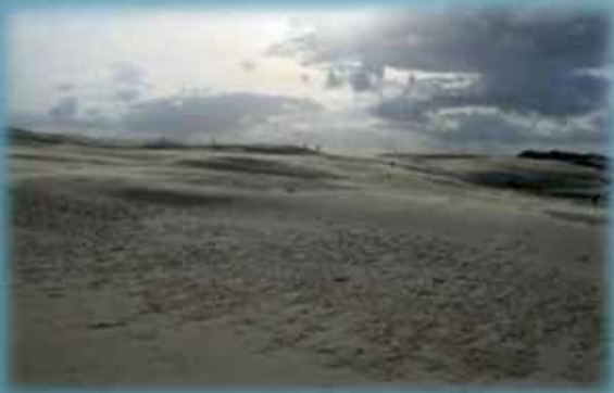
Vandrande dyn vid Råbjergs mile, Skagen (Pål-Axel Olsson)