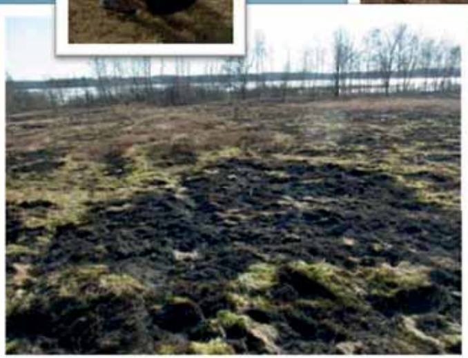
Bränd yta på Revingehed 2013