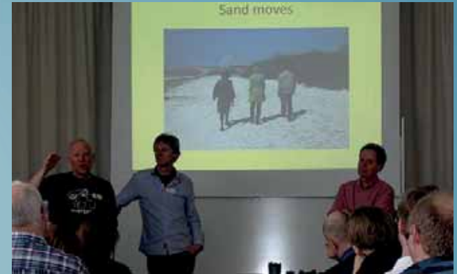
Workshop Halmstad mars 2013