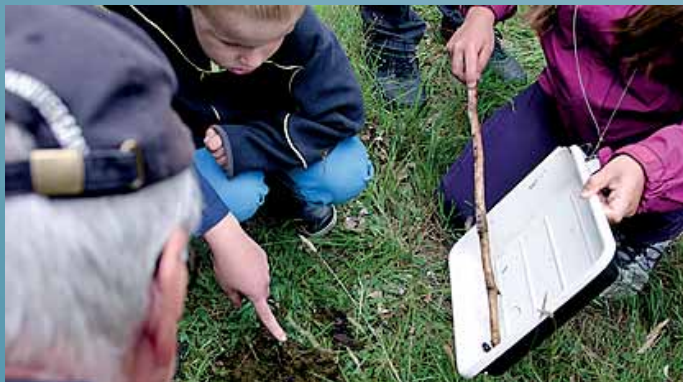
Guidning på Revingehed juli 2013