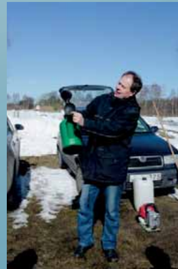
Bränningskurs i Hagestad mars 2013