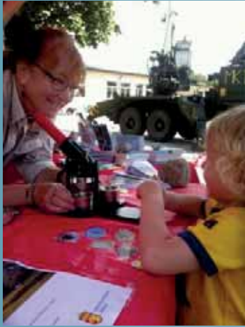
Utställningar Regementets dag 2013