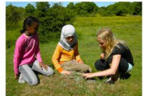
Ulf Lundwall (red) och Ulf Lundwall (red) på bilden i juni 2008.

En utomhuspedagogisk verksamhet som bedrivs på Hörjelgården sedan 1970-talet. Den är en del av NaturSkyddsföreningens verksamhet i Skåne. Den är en del av NaturSkyddsföreningens verksamhet i Skåne. Den är en del av NaturSkyddsföreningens verksamhet i Skåne.