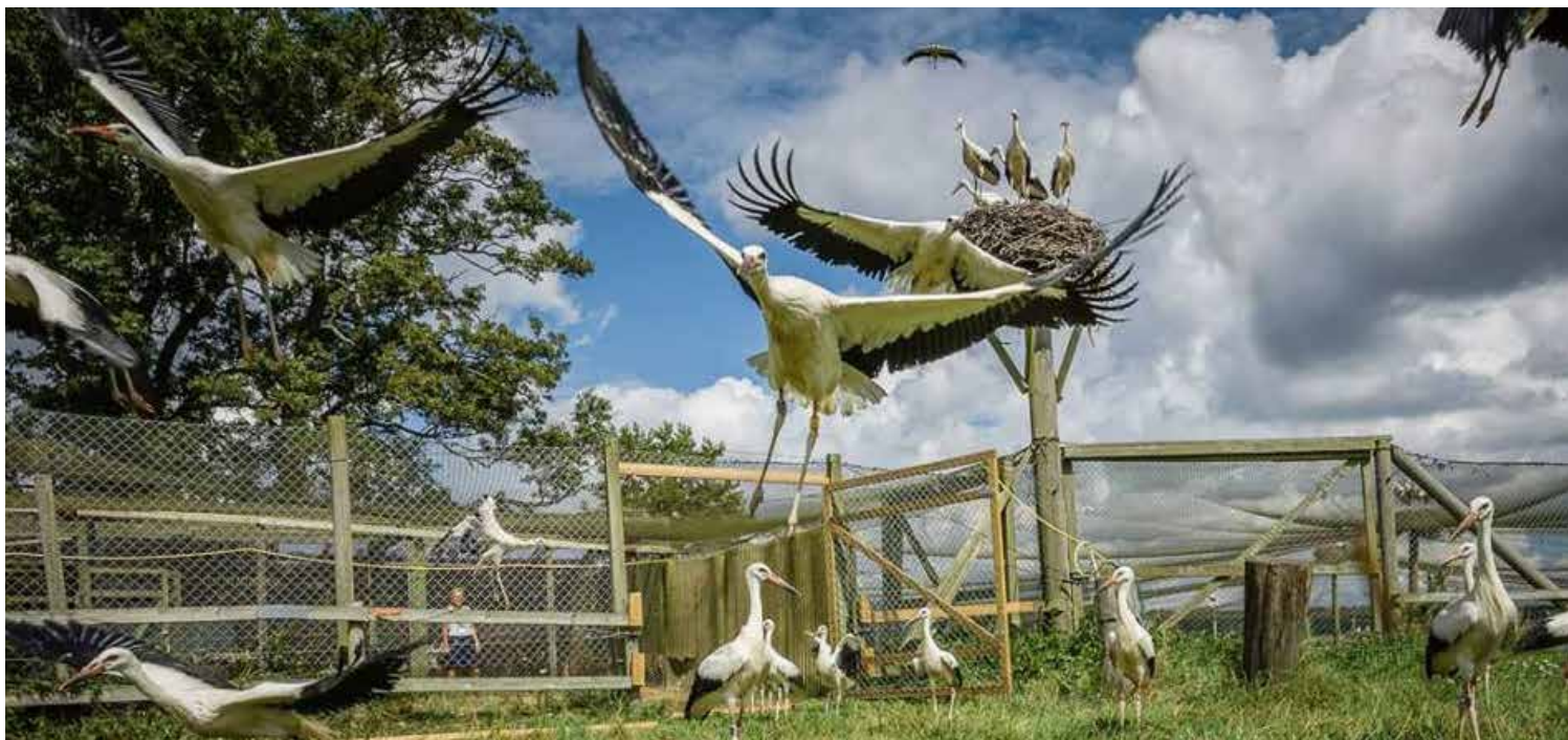
Sista helgen i juli sker sedan några år Storksläppet vid Hemmestorp som blivit ett mycket uppskattat och välbesökt evenemang som också ger klang medialt. Foto Sven Persson (något beskuren).

ett stort antal flygfärdiga ungfåglar som kan flytta tillsammans med ungar som har fötts i frihet, vilket vi gör under ett event i juli.