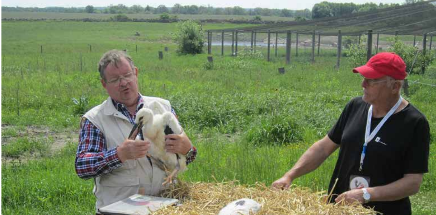
Volontärernas insatser är ovärderliga! Här ringmärkning av storkar vid Fulltofta.

Uppdragen kan exempelvis utgöras av att beskriva smultronställen (till app och hemsida), att hjälpa kretsar med hemsidor och aktivitetskalender, E-postdetektiver, att röja och slått/ praktisk naturvård (Hörjel och kretsars ängar), mata storkar, översätta hemsidor och programpunkter till andra språk, genomföra butiksundersökningar och vara funktionärer på utställningar, event och mässor.