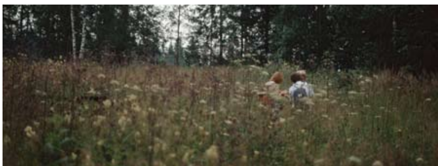
En andra chans – återplantering av arter och förstärkning av populationer

ÖRNBRÄKEN har ett mycket kraftigt system av jordstammar och kräver upprepad slåtter under en säsong för att kunna utrotas. En annan metod att bekämpa den är att slå av stjälken strax under bladen. Resten av stjälken får stå kvar. Sedan åtgärden upprepats några gånger torkar roten ut och växten dör.