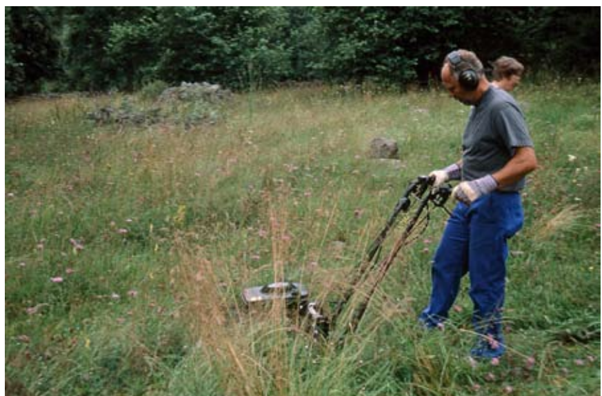
Slätter med slätterbalk.

Hamlingsträd som inte skördats på löv under de senaste decennierna bör restaureringshamlas. Utförd