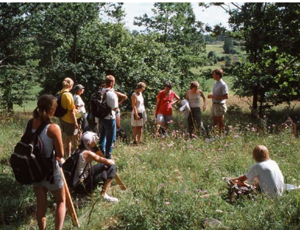
Naturskyddsföreningen arrangerar regelbundet kurser i ängsskötsel.

Om man vill bidra till ängens överlevnad men saknar egen mark finns stora chanser att samarbeta med lantbrukare, andra markägare och arrendatorer. I skogsbygder är det som regel inget problem att hitta en lämplig äng att arbeta med. Däremot kan det vara svårt i slättbygder och runt våra större tätorter. Kontakta Lantbrukarnas Riksförbund (LRF), Ekologiska Lantbrukarna och hem-