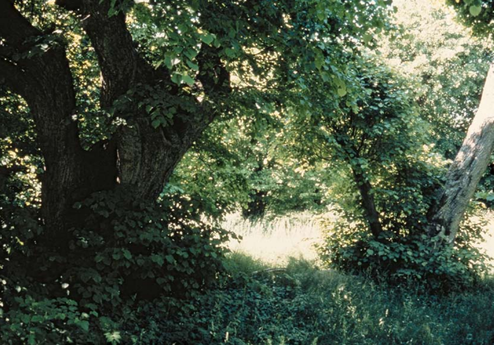
Löväng i behov av röjning.