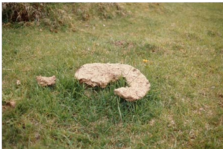
Spillning gödslar med kväve.

Nyligen har LRF startat en betesförmedling på internet i syfte att betesmarker skall utnyttjas effektivare och djurägare skall hitta betesmarker. Läs mer på www.bete.se