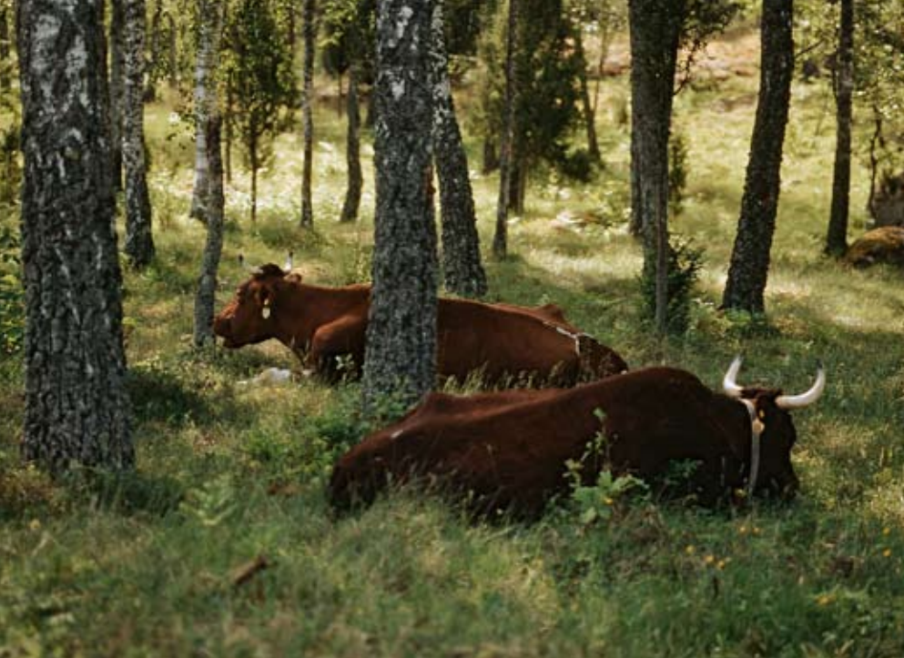
Till vänster en "typisk" löväng och ovan en "typisk" naturbetesmark.