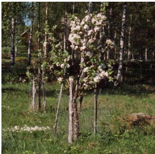
Plantering av apel på ängsmark.

Träden är viktiga för att få en uthållig och artrik löväng. De fungerar som ekologiska hjälpmedel, som kulturbärare och som hemvist för en stor del av ängens biologiska mångfald. Många av träden på dagens ängar är dock "förvuxna" och alltför höga,