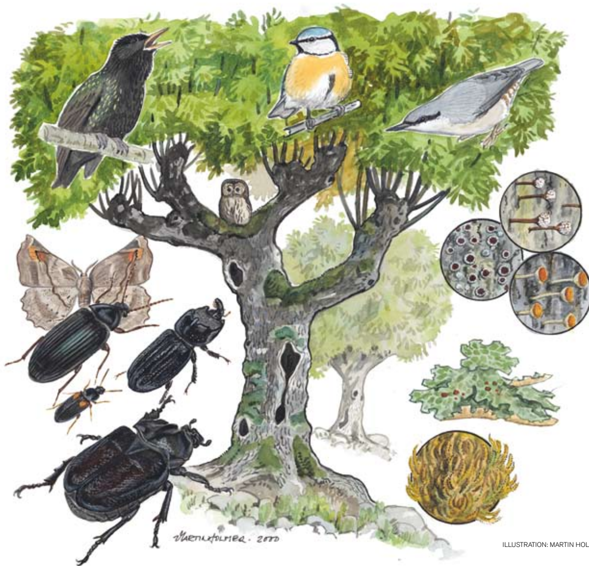
ILLUSTRATION: MARTIN HOLMER