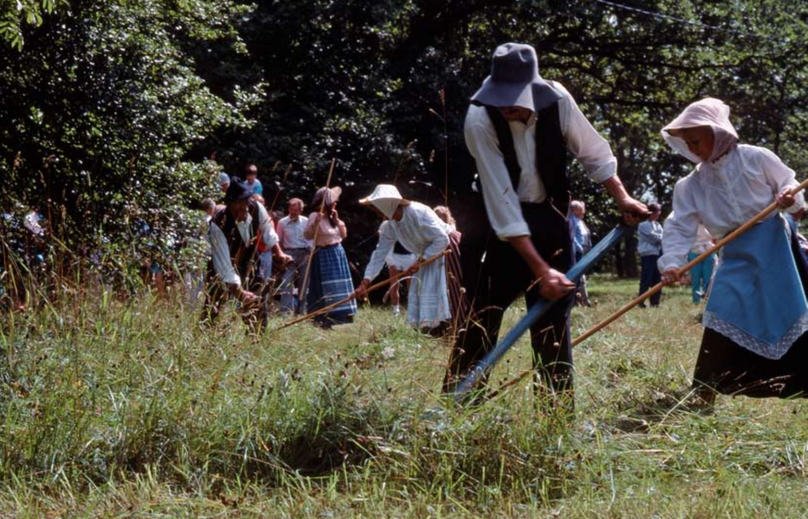
Lieslätter med tidstypiska kläder.

den gick efter. I Småland till exempel var det vanligt att man slog ängen när slättergubbens tre toppblommor slagit ut. Detta skedde, beroende av årsmån, mellan 5 och 15 juli. Sen slätter, till exempel ända in i september, ger av allt att döma upphov till ett minskat artantal i ängen.