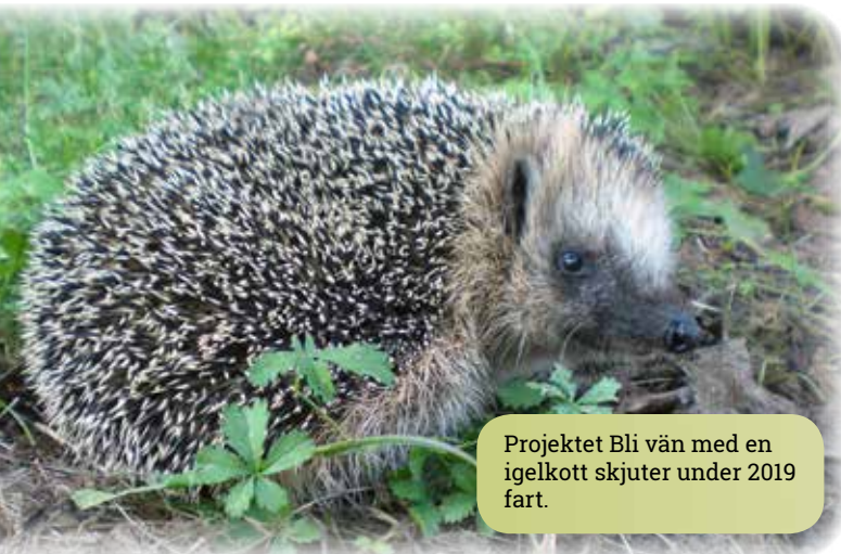
Projektet Bli vän med en igelkott skjuter under 2019 fart.

Projektet fortsätter arbetet enligt den modell som förfinats och vidareutvecklats de senaste åren. Varje år sparas ett antal årsungar för avel. När dessa individer blir häckningsmogna placeras de så att de inte går ihop med nära släktingar. Parbildningen sker i hägnen vid Karups Nygård och Hemmestorps mölla.