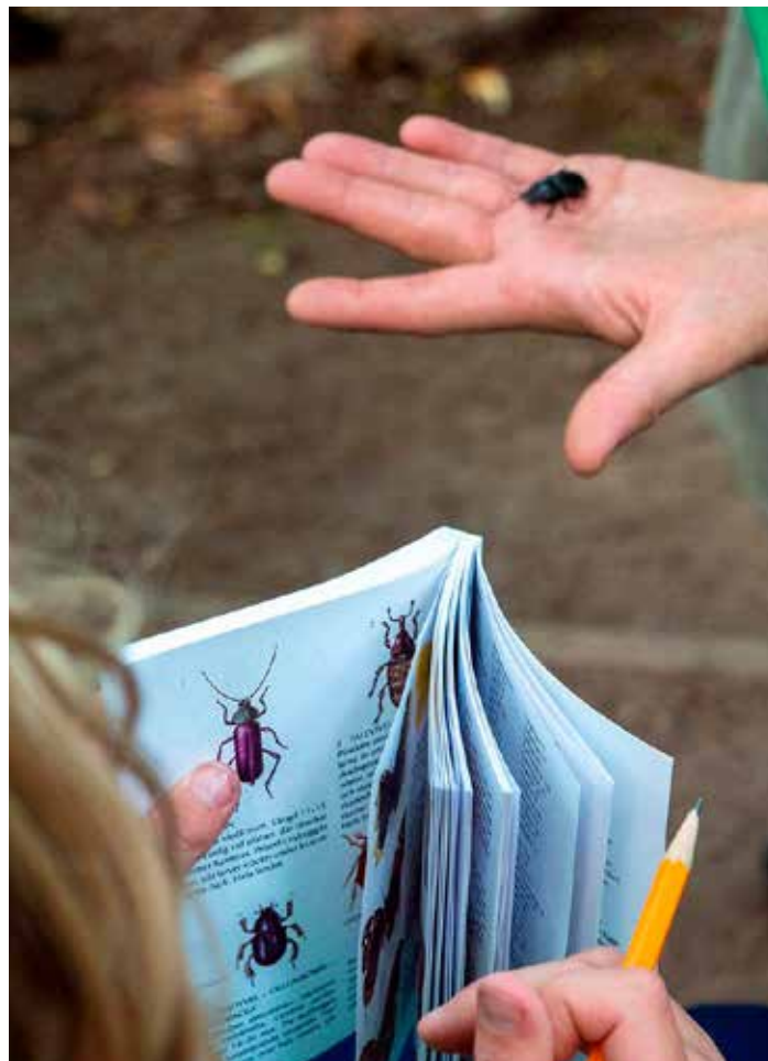
Naturkolloet gick lyckligtvis att genomföra.

Naturskyddsföreningen i Skåne har ansvar för konferensens ekonomi, ansökningar, avtal med föreläsare, redovisning och samordning.